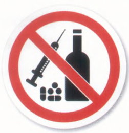
ПРОПАГАНДА НАРКОТИКОВ И АЛКОГОЛЯ